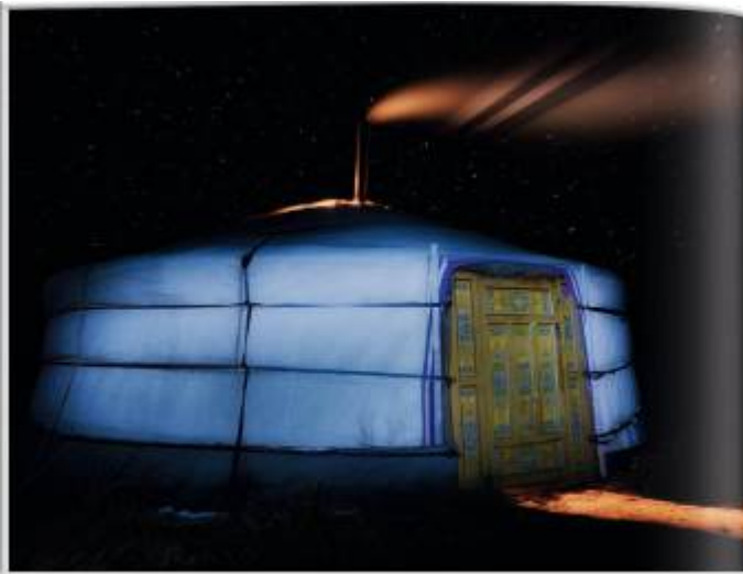
Mongolija, geris / Mongolia, Geris Geris yra būdingas ir patalpus būstas, kuriam būdingas apvalus viršelis ir plokščiasis pagrindas. Šiuos būstus randaime visose Mongolijos dalyse. Šiuos būstus randaime visose Mongolijos dalyse. Šiuos būstus randaime visose Mongolijos dalyse. Šiuos būstus randaime visose Mongolijos dalyse.